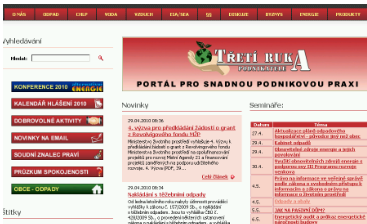
Obr. titulní strana www.tretiruka.cz